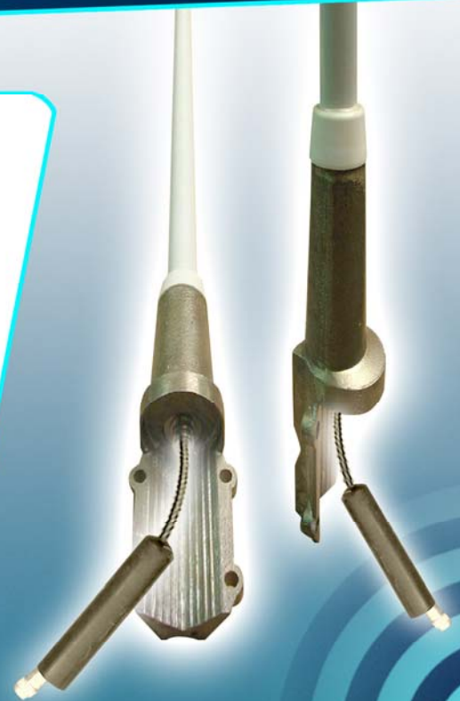
ANTENAS SKYPLUS MODELOS SKYR de UHF y VHF