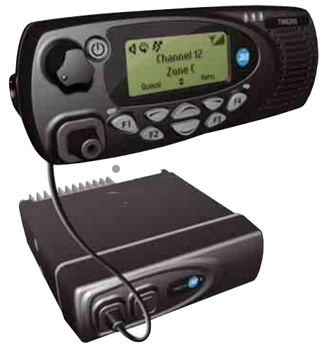
Opción de cabezal de control remoto

La pantalla alfanumérica y el teclado de fácil uso, y la estructura de menús intuitiva permiten que los usuarios puedan ver la información rápidamente y acceder a las funciones de la radio en situaciones muy variables, ya se trate de una persecución policiaca o del conductor de un camión que esté respondiendo a un trabajo de despacho urgente.